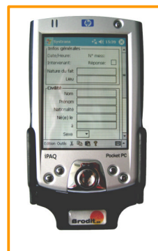
PDA avec exemple de formulaire

La station mobile est utilisable en phonie de façon classique à l'aide du microphone et du haut parleur standard de l'appareil.