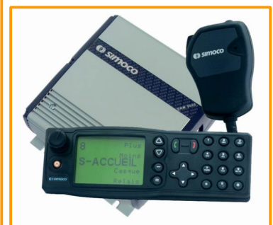
SRM9030 avec sa console et son micro